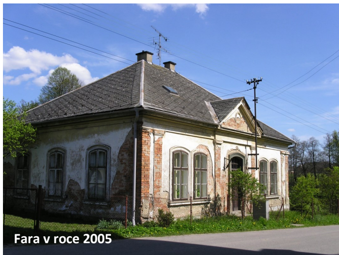
Fara v roce 2005