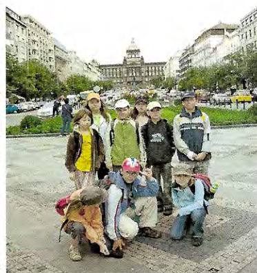
Na obrázku: děti ze ZŠ Luková na Václavském náměstí, v pozadí: Národní muzeum

Pak už jsme se těšili na cestu metrem a hlavně na jezdící schody. Koupili jsme si pití do vlaku na zpáteční cestu a hurá na nádraží. Výlet se nám vydařil, hodně jsme toho viděli a i počasí nám přálo. Ale na prohlídku Prahy, by bylo potřeba několik dní. Tak snad někdy příště nebo s rodiči o prázdninách. Stojí to za to.