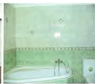
Nové malometrážní byty v přízemí : kuchyň, koupelna