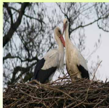
Informace o čápech a obě foto: Ing. Stanislav Vimr

Také už se přihodilo, že se čáp v Lukové zranil na vedení vysokého napětí a musel být odvezen do záchranné stanice Zelené Vendolí, kde však tehdy zkonstatovali, že čáp má natolik poraněné nohy, že nezbývá než ho utratit. Doufejme, že tyto čápy na hnízdě bude čekat lepší osud a že budou mít v životě štěstí.