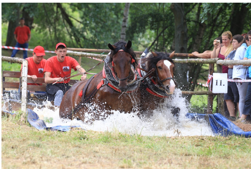
Nová disciplína: průjezd dvojspřeží vodním příkopem