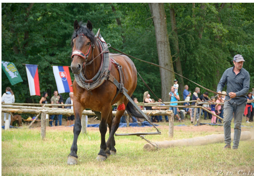
Disciplína: ovladatelnost koně s kládou

Je dobře, že se poslední dobou dostává více pozornosti a ocenění těžké práci, kterou tyto krásní a houževnatí koně dokážou se svými kočími odvést a zároveň šetřit životní prostředí.