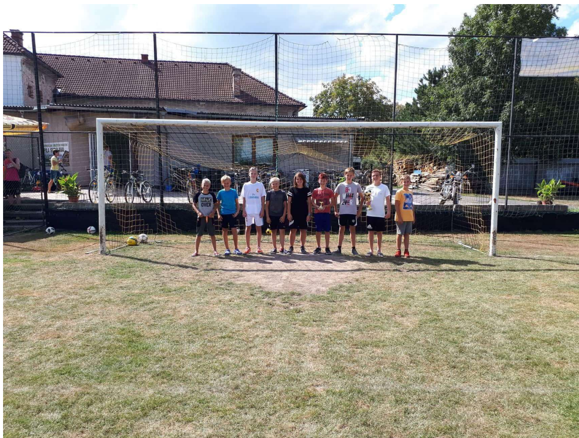
Turnaj starších žáků ve Srubech