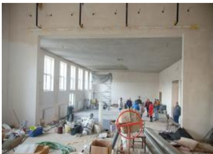
Kontrolní den na staveništi se zastupiteli, zástupci stavební firmy a stavebního dozoru

Stejně jako v uplynulých dvou letech, i v tomto roce se obec ze všech investičních akcí nejvíce zabývala opravou kulturního domu. Oprava se už rychle blížila k závěru.