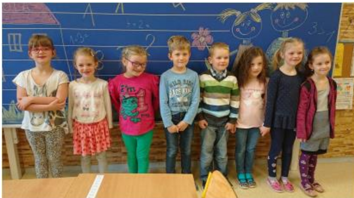
Zápis do 1. třídy