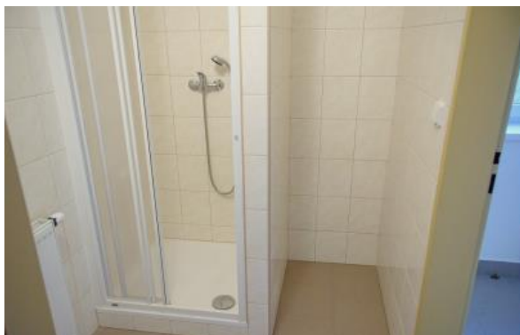
Sprchy, sál tělocvičny

Rovněž v nově opravených prostorách tělocvičny v 1. patře budovy KD byl spuštěn tzv. ostrý provoz, kdy byly stanoveny podmínky pro její využívání. Cena za pronájem byla stanovena na 100 Kč za hodinu pro místní občany a 200 Kč pro přespolní návštěvníky. Základní a mateřská škola mohou tělocvičnu využívat zdarma, rovněž tak členové TJ