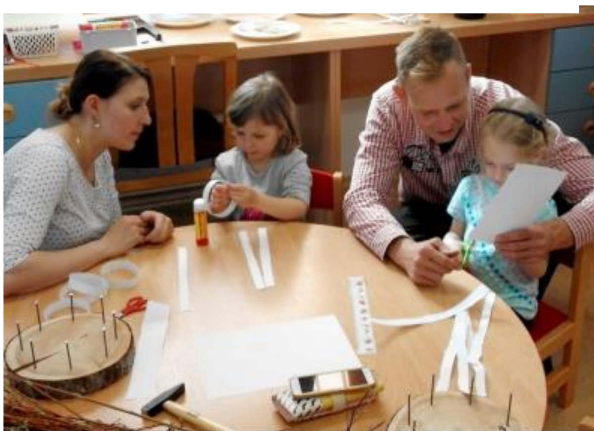
Tradiční dílničky s rodiči