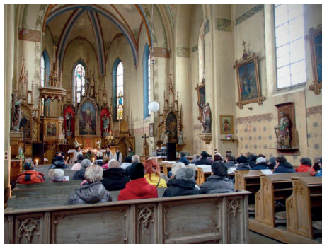
Adventní koncert 2.12.2018: